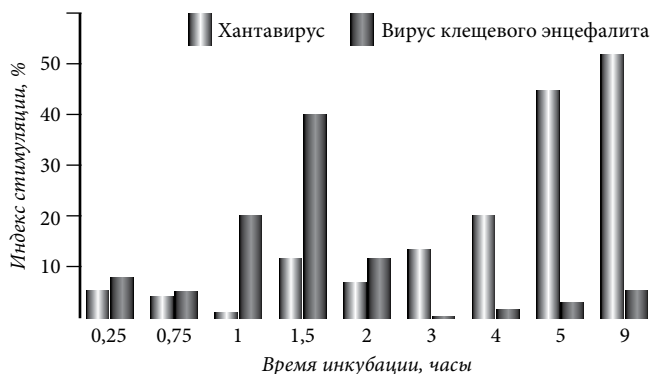
Рис. 2. Изменение активности АМФ в инфицированных вирусами нейтрофилах первичной культуры.

Активность миелопероксидазы (МПО) определяли путем добавления к монослою клеток 100 мкл раствора (4 мг о-фенилендиамина на 10 мл фосфатно-цитратного буфера с рН 5,0 и добавлением 500 мкл 0,33 % перекиси водорода). Выявление активности катионных белков проводили путем добавления к монослою клеток 50 мкл раствора зеленого прочного