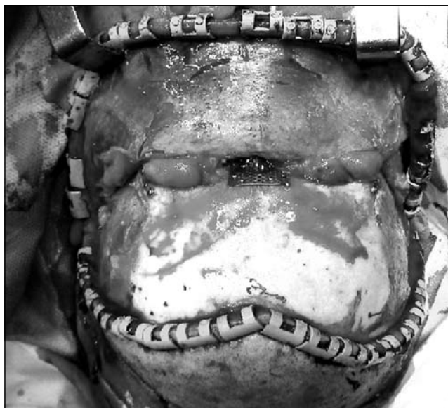
Рис. 2. Битемпоральный доступ.

При краниофациальной травме легкой и средней степени, сопровождавшейся сотрясением или ушибом головного мозга легкой степени (172 пациента – 69,1%), во время операции костные отломки максимально сохранялись и также фиксировались титановыми