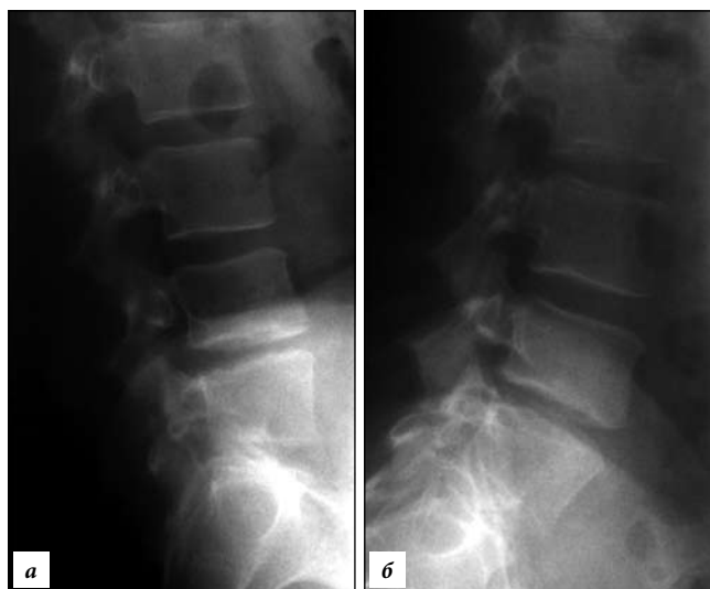
Рис. 2. Поясничная спондилография с функциональными пробами:

а – сагиттальная томограмма (стрелкой указана грыжа диска L_4-L_5 ); б – фронтальная томограмма (стрелкой указана грыжа диска L_4-L_5 ).