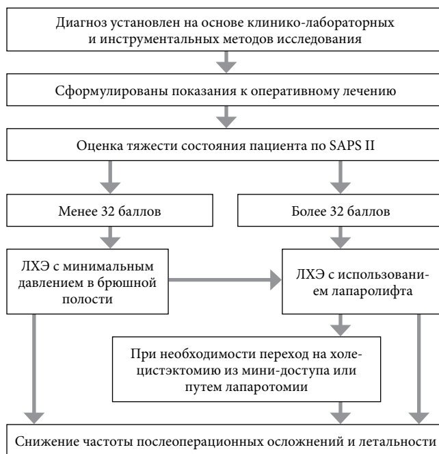
Рис. 2. Алгоритм прогнозирования способа хирургического лечения острого деструктивного холецистита.

Полученные в ходе исследования данные позволили разработать алгоритм прогнозирования способа хирургического лечения больных острым деструктивным холециститом с повышенным операционно-анестезиологическим риском (рис. 2).