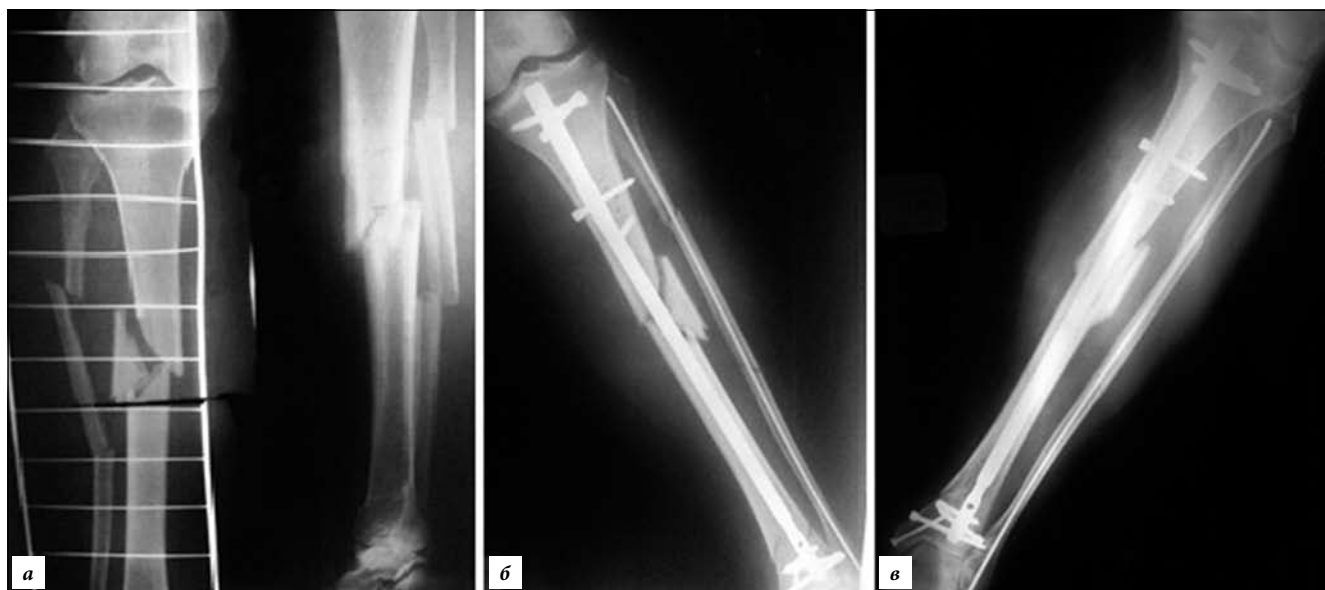
Рис. 5. Пациент А., 70 лет, фрагментарный перелом обеих костей голени – 42 В2 и 43 А1 (фрагмент малоберцовой кости локализован на уровне диафизарного перелома). Интрамедуллярный остеосинтез обеих костей голени (рентгенография):

а – до операции; б – сразу после операции.