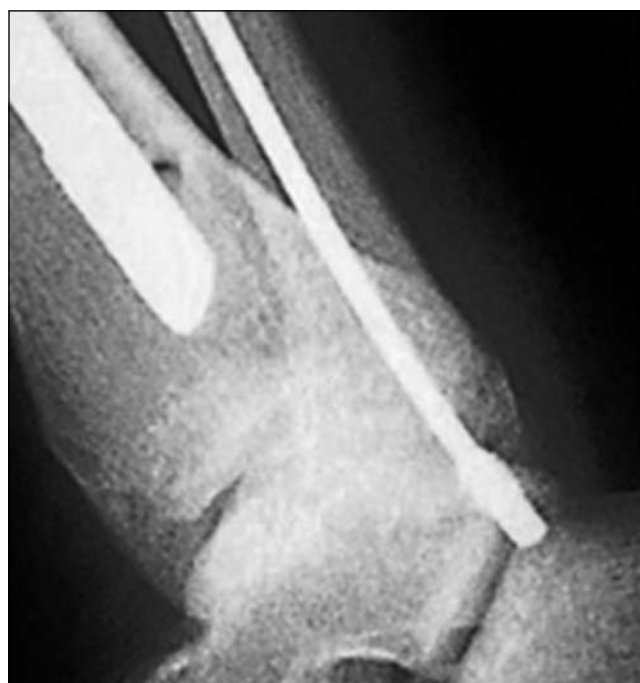
Рис. 2. Выступающий конец стержня фиксирован концевым колпачком для предотвращения миграции.

Послеоперационный режим для пациентов наряду с рекомендациями по физиотерапии заключался в ходьбе на костылях, соблюдении стандартной схемы с дозированной ранней тензометрической нагрузкой на поврежденную конечность с усилием 10–20 кг в течение 1,5–2 месяцев [1]. По окончании данного периода