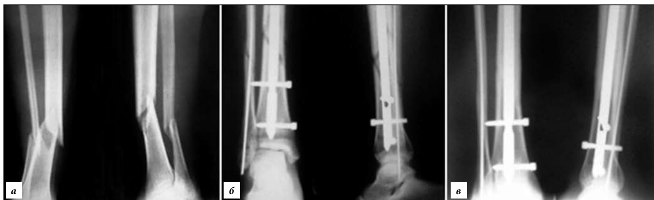
Рис. 3. Пациентка М., 29 лет, косой перелом обеих костей голени ниже истмальной части на одном уровне – 42 А2. На 4-е сутки выполнен интрамедуллярный остеосинтез большеберцовой кости тибиальным стержнем и малоберцовой кости – эластичным титановым стержнем (рентгенография):

а – до операции; б – сразу после операции; в – консолидация через 16 недель после операции.