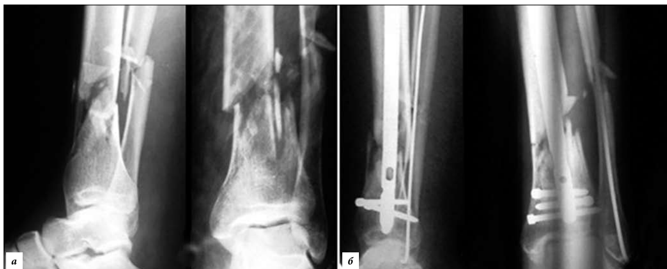
Рис. 4. Пациент С., 44 лет, закрытый оскольчатый перелом костей голени – 42 В3. Интрамедуллярная фиксация обеих костей выполнена на 7-е сутки (рентгенография):

а – до операции; б – сразу после операции; в – консолидация через 16 недель после операции.